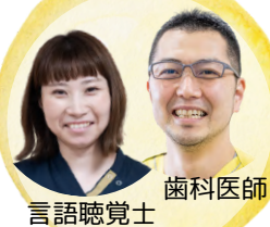
言語聴覚士 歯科医師

1階 会議室 ①11:00~11:20 ②11:30~11:50 ③14:00~14:20 ④14:30~14:50