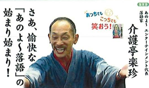
介護亭楽珍 あのよ~エンターテインメント代表